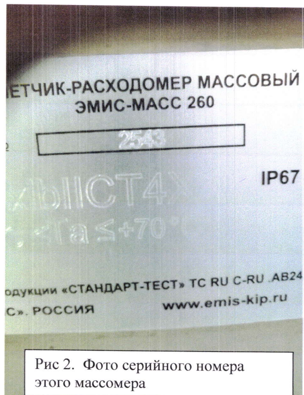
Рис 2. Фото серийного номера этого массомера